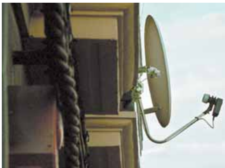
Antena de televisión digital.